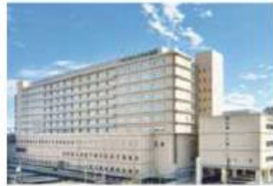
岡山済生会総合病院 (国体町)