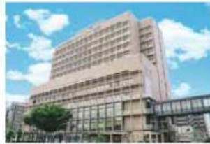
岡山済生会外来センター病院 (伊福町)