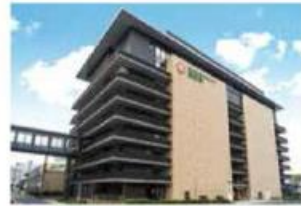
岡山済生会予防医学健診センター (伊福町)